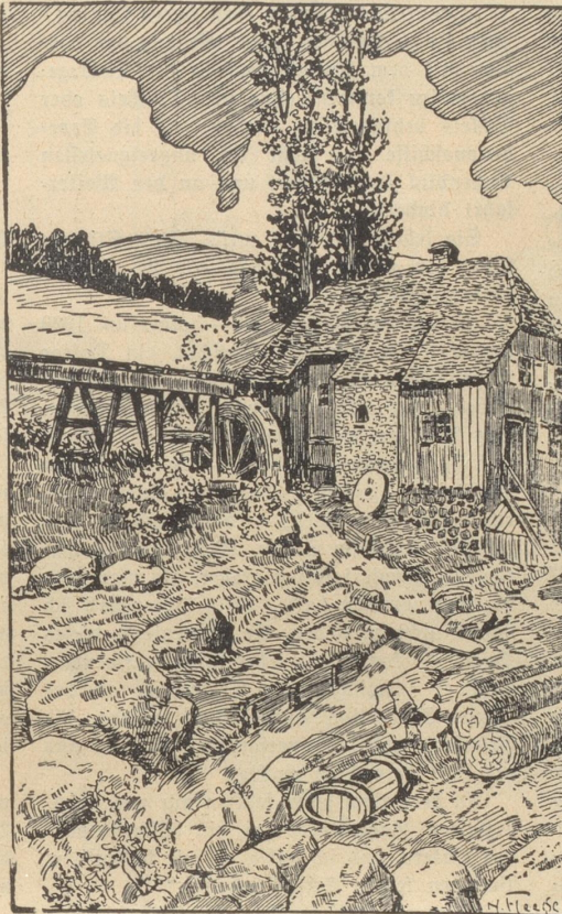
Wo ist der Müller?