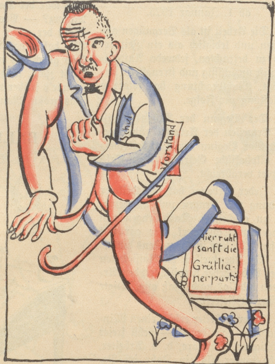
Herr Ribl denkt: „Er ist doch mein“. Schon stolpert er an einem Stein.