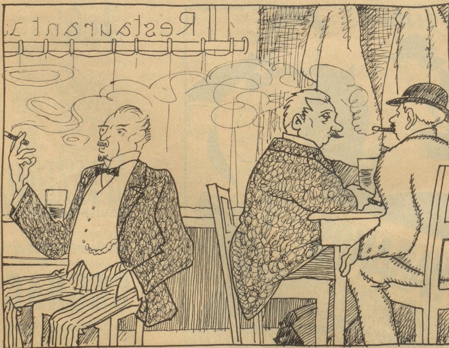
Erkennungszeichen in der Fremde.