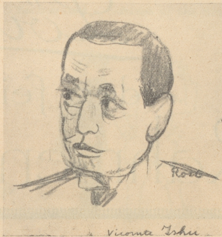
Vicomte Ishii Japanischer Gesandter in Paris.