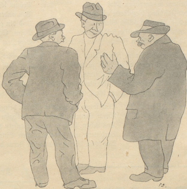
Die neuen Tramabonnemente sind billiger, aber es sind weniger Fahrten drin, und meine Cervelat kosten nur noch 75 Rappen vier Stück, aber es gibt dafür nur noch drei.

Was dem einen recht ist — ist dem andern billig