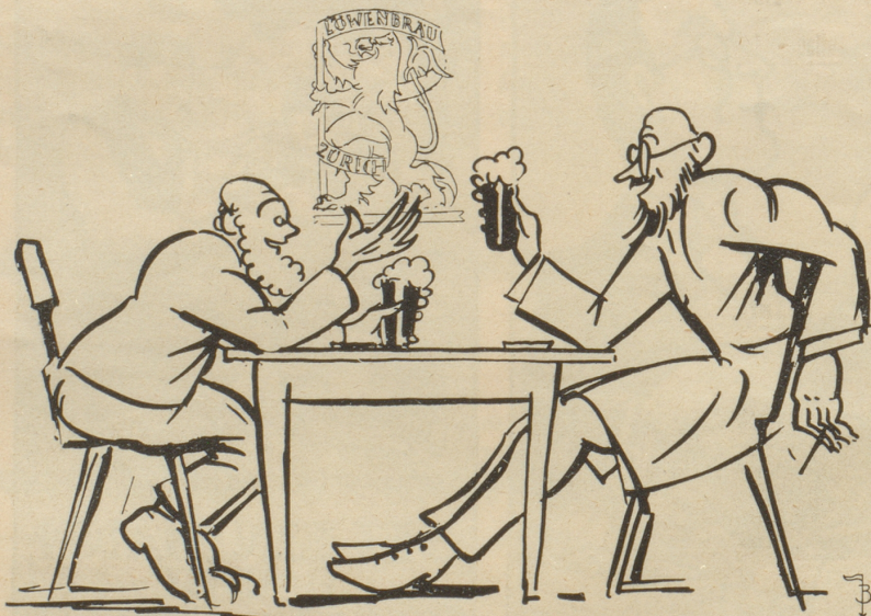
Dhni „Zürcher Löwenbräu“ würd is kein Tag meh ushalte, Herr Dokter!

Der Schwimmklub St. Gallen hat kürzlich einen Tanzabend ver-