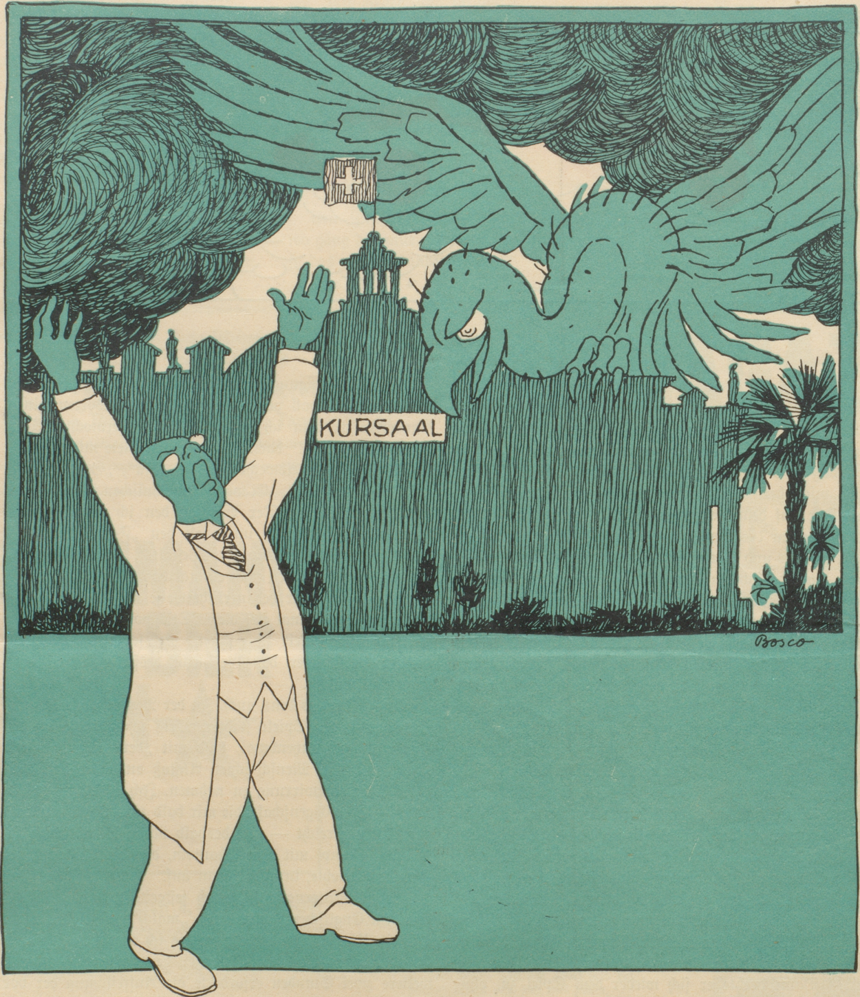
„Ein Königreich für ein „Rößli“!“

professoren, knüpfte mit vier geborenen Engländerinnen zarte Verhältnisse an, entließ meine Stenographistin und ersetzte sie durch ein Mitglied eines Damenfußballklubs — alles umsonst. Kein Mensch wußte zuverlässige Auskunft, ob „der“ oder „das“! — Als ich es in Sportskreisen bereits zu einer gewissen, anrühmigen Berühmtheit gebracht hatte, knöpfte ich mir als ultima ratio meinen jüngsten Stief vor, von dem ich wußte, daß er in Fußballsachen besser Bescheid wußte, als in der mancolosen Führung der Portokasse. Unter Anwendung aller erdenklichen Listen zwecks Wahrung meiner Autorität legte ich ihm die ominöse Frage vor und