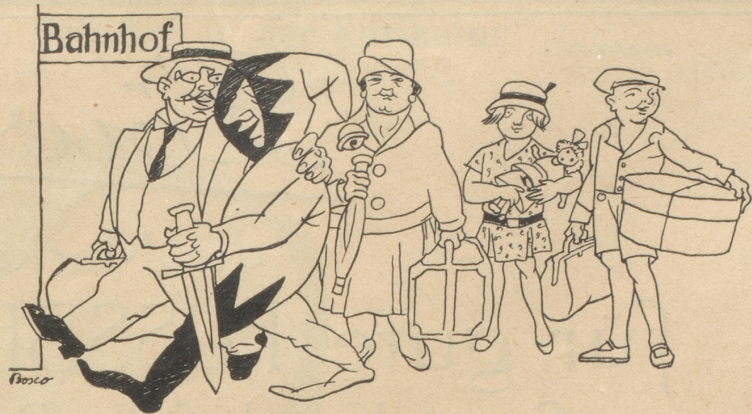
„Der Nebelspalter muß mit in die Ferien!“

Im Kanton Baselstadt findet am 26./27. Juni eine Volksabstimmung statt über ein Initiativebegehren betreffend den Bau von Wohnungen durch die Einwohnergemeinde der Stadt und betreffend Unterstützung ge-