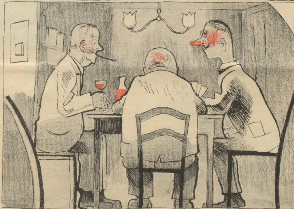
Gestern noch auf hohen Rossen — heute wieder . . . Eidgenossen