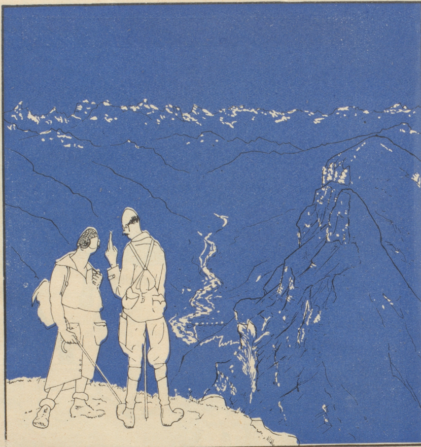
„Ein Paradies! — Nach den Ferien muß mir die ganze Klasse einen Kuffag über diese Gegend schreiben!“

Und neben mir saß ein fröhliches Kind, Das horchte mit mir und lauschte, Wie alles von rechts und alles von links Von Flirt und Liebe nur plauschte. Und leise schob sich ihr Händchen in Meine derben, gewaltigen Pranken, Und ich — ich küßte den kirschroten Mund, — Natürlich nur in Gedanken. — Fränzchen