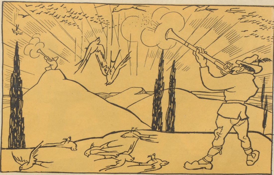
Erst hat man in Italien den Zugvögeln die Ausreise verboten,