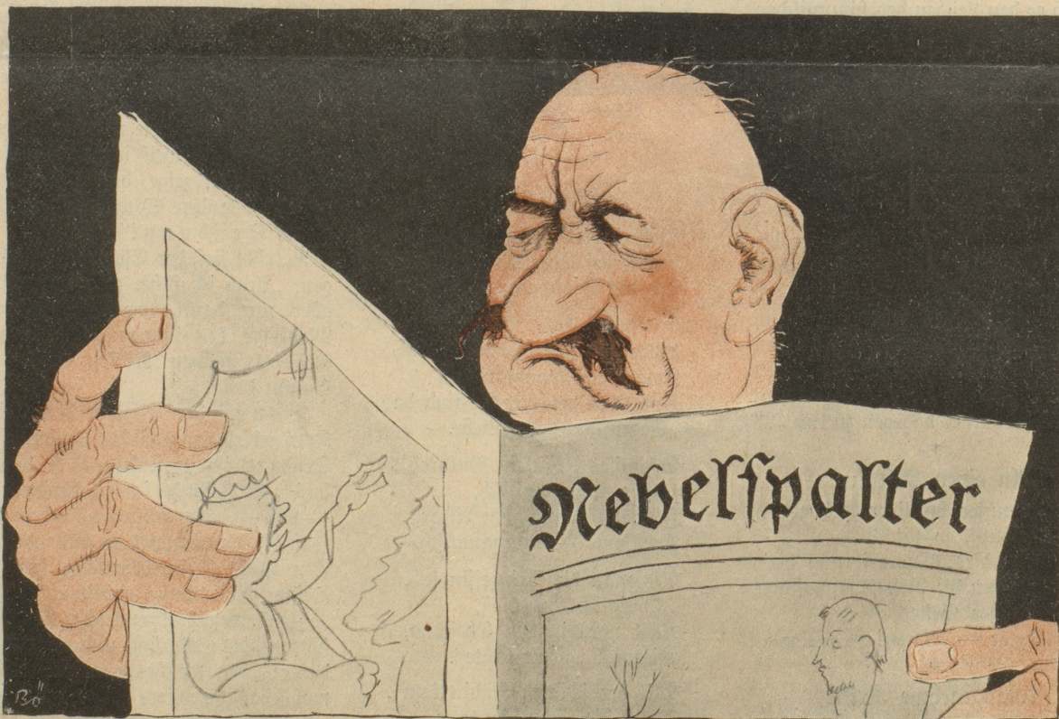
Man ist Helvetier, ist verschnupft, fühlt sich gestochen und gerupft, und runzelt.

Alleinige Anzeigen-Aannahme: Annoncen-Expedition Rudolf Mosse, Zürich und deren Filialen. Insertionspreis: 70 Cts. die fünfgespaltene Nonpareillezeile; Fr. 1.50 die dreigespaltene Zeile im Textteile. — Redaktion: Paul Altheer, Scheuchzerstrasse 65, Zürich. Tel. Hott. 31.75. — Druck und Verlag: E. Löpfe-Benz, Rorschach. Tel. 3.91. Der «Nebelspalter» erscheint wöchentlich. Abonnements nehmen alle Postbureaux, Buchhandlungen und der Verlag jederzeit entgegen. Der Preis beträgt in der Schweiz für 3 Monate Fr. 5.50, für 6 Monate Fr. 10.75, für 12 Monate Fr. 20.—. Der das Abonnement vom Verlag direkt beziehende in der Schweiz wohnende Abonnent und dessen Ehefrau sind bei der Schweizerischen Unfallversicherungs-Gesellschaft in Winterthur gegen Unfälle in und ausser Beruf versichert und zwar mit je Fr. 1000.— im Todesfall, Fr. 2000.— im Ganzinvaliditätsfall und Fr. 60.— bis Fr. 1200.— bei nur teilweiser Invalidität. Der das Abonnement durch eine Buchhandlung und dergl. beziehende in der Schweiz wohnende Abonnent und dessen Ehefrau gelten im gleichen Umfange als versichert, sofern sich der Abonnent direkt oder durch die Buchhandlung beim Verlag schriftlich zur Versicherung anmeldet. Im Ausland kostet der Nebelspalter für 3 Mon. Fr. 8.50, für 6 Mon. Fr. 17.—, für 12 Mon. Fr. 31.— Nachdruck nur mit Quellenangabe.