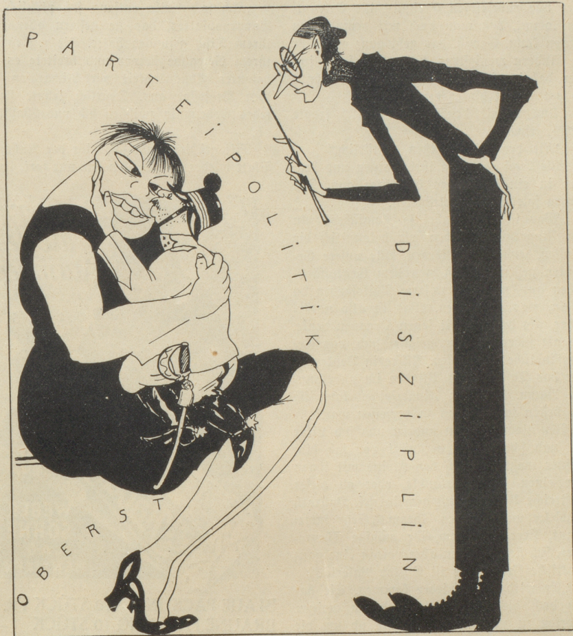
Anstatt, wie es sich ziemt für ihn, sich haltend zu der Disziplin,

„Wie meinen Sie das, Herr Wassiliew?“ Erika vermag sich ebenso wenig wie ihre beiden Herren dem fremdartigen Banne dieses Plauderers zu entziehen. Entschieden: er versteht auch durch das Wort zu fesseln.