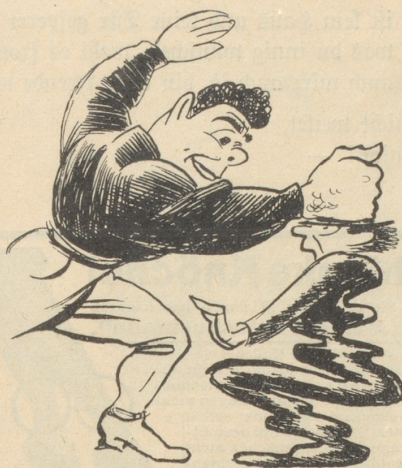
So . . . nur eine kleine Einschüchterung.