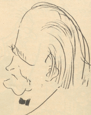
Der Mann der so fabelhaft Beethoven spielt.

Romont erfaßt und getötet. Seine Eltern bewohnen ein nahe dem Geleise gelegenes Bauernhaus, und der Kleine spielte auf demselben, als der Zug herankam. — Wenn also der Knabe auf dem Bauernhaus spielte und dabei unter die Räder des Zuges kam, dann fährt, was eigentlich bisher nicht bekannt war, der Zug Bulle-Romont geradewegs über das Haus der Eltern des armen Bubleins hinweg. Dann hätte man es aber auch nicht auf dem Haus spielen lassen dürfen.