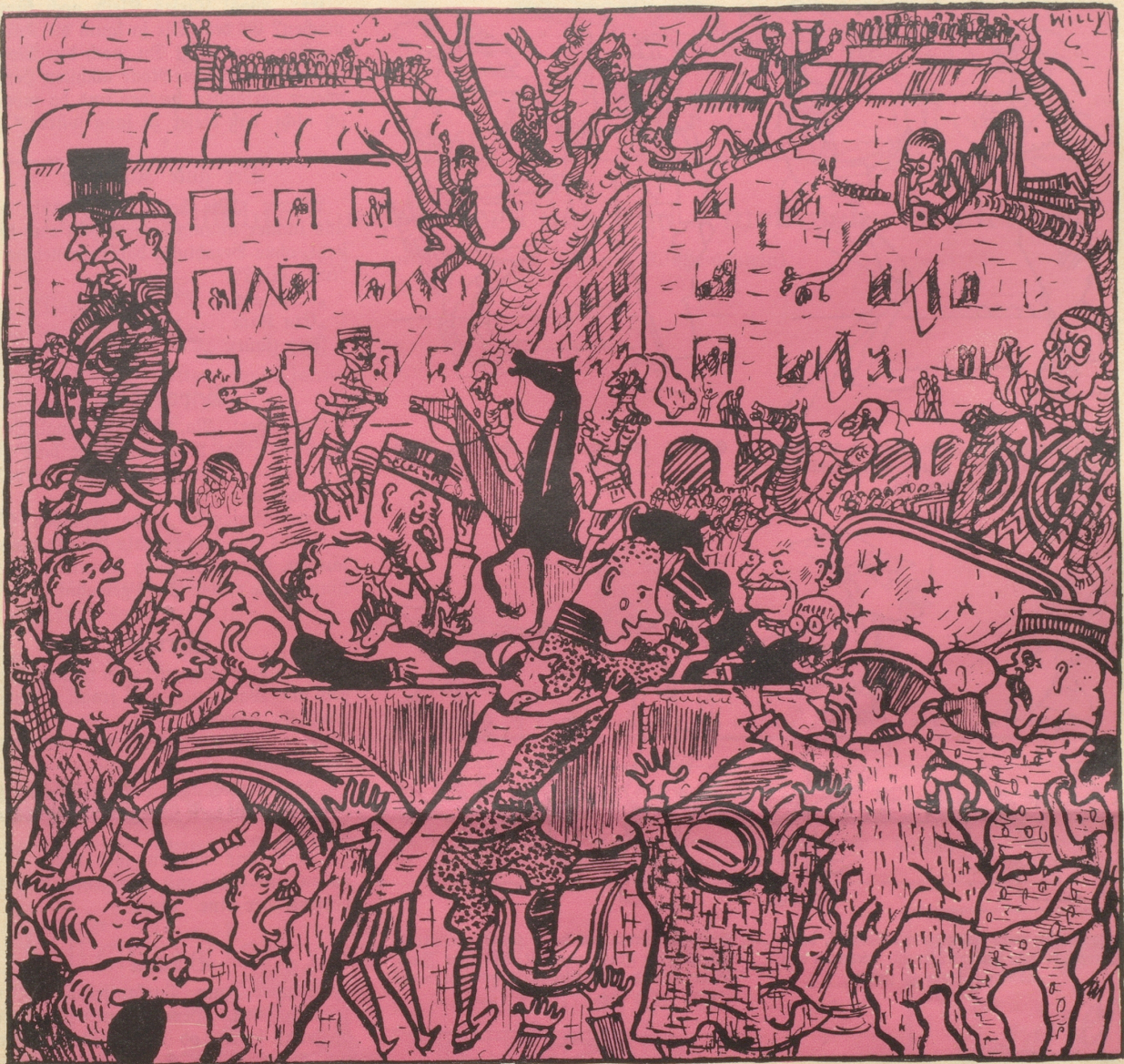
Der erst siebenjährige Charly Kurzhofer entwich per Avion aus dem Elternhaus. Begeisterter Empfang in Paris.

oder: Wer einmal Rekorde treiben will, fliegt beizeiten.