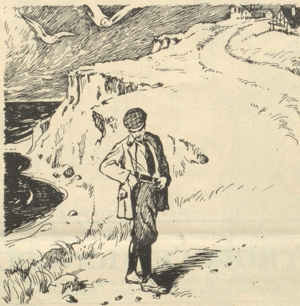
... fand ich kleine Sandstellen, auf denen die Spur seiner Strandschuhe und auch des bloßen Fußes sichtbar war.

Ich riet ihm, sofort zu seinem unmittelbaren Vorgesetzten und zu einem Arzt zu schicken, außerdem zu verbieten, daß irgend etwas angerührt würde und so wenig wie möglich Fußspuren machen zu lassen. Inzwischen untersuchte ich die Taschen des Toten. Ich fand darin sein Taschentuch, ein großes Mess-