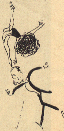
Das Unglück naht