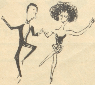
Ein Tänzerpaar, das hoch in Gunst, Doch schlecht bezahlt, denn das ist Kunst.