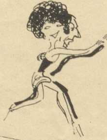
Folgt dieses da