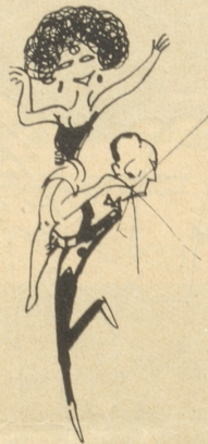
Der Beifall rauscht