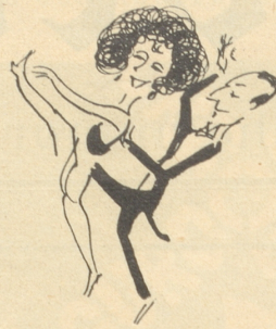
Und dann oho