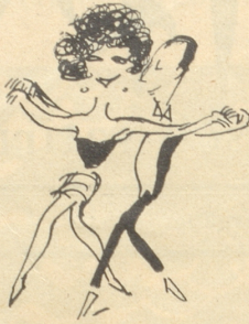
Erst macht es so