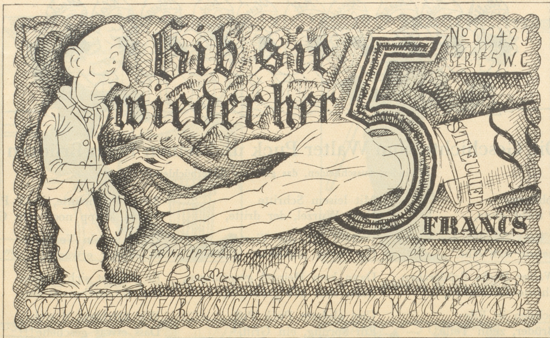
Ein weiterer Vorschlag des „Rebelspalter“ für eine neue Fünffrankennote.