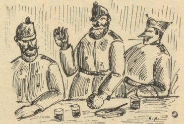
. . . . är heig am meischte Erfahrig u sy am längste drby gsi.

ere Brügg stah u luege, daß se d'Finde nid ussprängi. Du isch's aber e so gottsjämmerlig cho rägne, un i ha dächt: Nei!