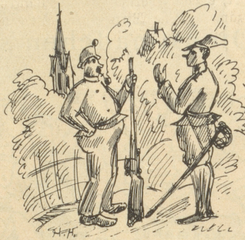
Du, los grad, Houpmé . . .

Isch da eine ufgtange mit eme todärnschte Gesicht. Mir het dütlech gseh, daß er öppis uf em Gwüsse het. „Mini liebe Kamerade,“ het er gseit, „i will nech hüt isz öppis säge, wo-n-i sit Jahre nume für mi alei bhalte ha. Mir si einisch