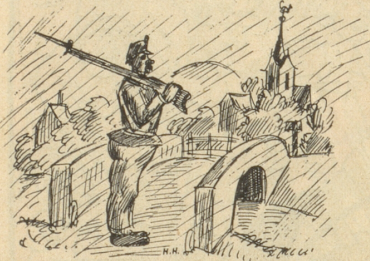
Da han i emol o einisch solle uf ere Brügg stah u luege, daß se d'Finde nid ussprängi.

Wie's de albe geit, we so Dienstsamerade zäme chöme: Si tüe öppe ihri