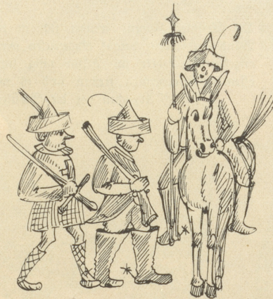
Ha Ha . . . eine kleine Polizeitruppe vorgesehen.

Alle Länder (die Meere sind's ja schon) werden britisch. Die politischen und administrativen Verhältnisse bleiben wie bisher, mit der Ausnahme, daß in jedem Lande ein britischer „Resident und Berater“ der Landesregierung „beisitzt“. Er hat die Kontrolle über die Finanzen