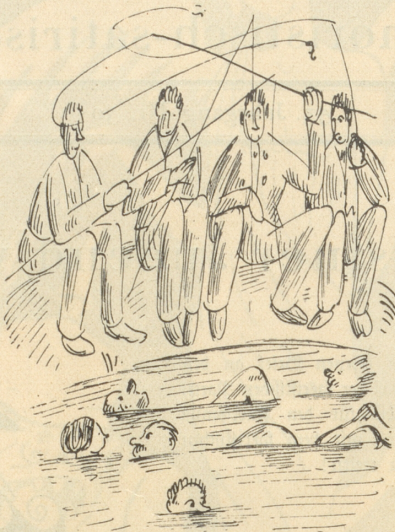
Ha Ha Menschheit aus dem Sumpf . . . .

Betrachte ich die Erdkarte, so sehe ich sofort (in der Tat weiß es jedes Kind),