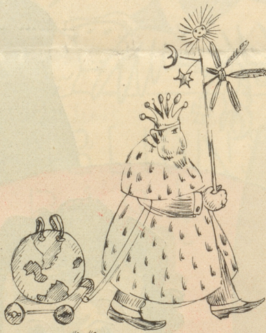
Ha Ha „Emperor of the Universe“

Die Mittel zu diesem Zweck werden seit Jahren und Jahren in allen internationalen Versammlungen in Genf und anderwärts, in Regierungskreisen, Vereinen, Parteien und Wirtschaftskreisen erörtert. Alle wollen nur das Beste der Menschen: Frieden, Fortschritt, Arbeit. Ungeheure Mengen an Energie und Geld, an Weisheit und Ausdauer werden verschwendet. Der geringste scheinbare Fortschritt wird hoch gefeiert. Auch mich ehrsamem Bürger beschäftigt das Ding. Eines Nachts konnte ich darüber nicht schlafen, bis mir ein Blitzstrahl durchs Gehirn fuhr: Ich hab's gefunden; Unbegreiflich, wie die Menschheit so dumm ist, die Führer und die Geführten, daß sie