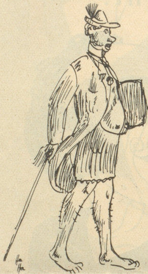
Ha Gelbe und Gemischte . . . .

daß ein großer Teil der Erde unter britischer Herrschaft steht. Seit Jahrhunderten hat sich diese über die verschiedensten Zonen und Völker ausgebreitet. Was