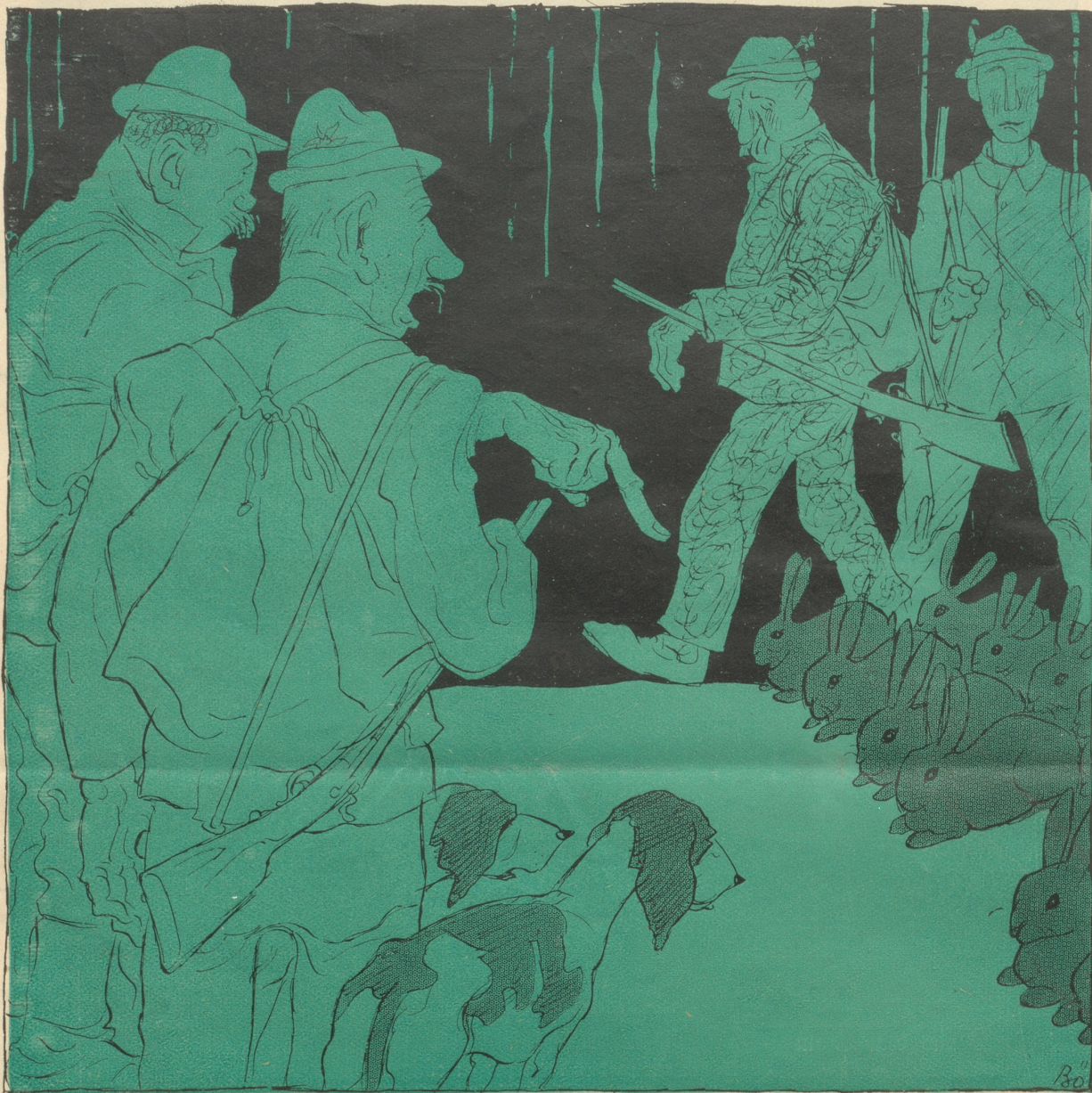
Vor der Jagd: „Uffschlüsse, Dunnerwetter, da chönt wieder ein suber denebetschlüße!“

(Die Patentjäger haben die st. gallische Regierung ersucht, Hasen einzufangen. Das ist auch unseres Erachtens das einzig richtige, man lege Witz ein, damit es überhand nimmt, und schieße es ab, damit es nicht überhand nimmt.)