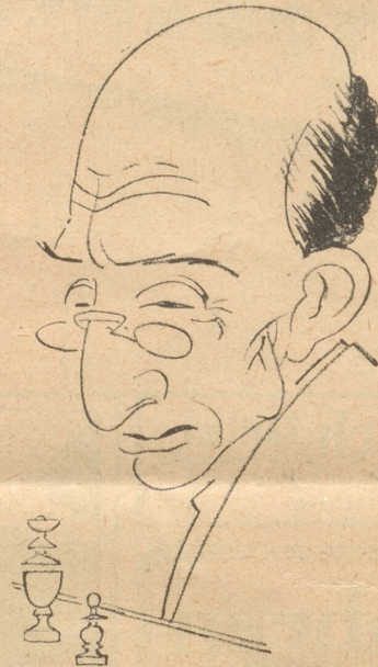
Der Weltmeister im Schachspiel.

werden wohl wissen, um was es sich handelt. Er hat nicht die Absicht, sich von Ihnen ins Geschäft pfuschen zu lassen. Haben Sie verstanden? Sie sind nicht Hüter des Gesetzes und ich ebensowenig, und wenn Sie sich hier einmischen, werde ich auch bei der Hand sein. Also merken Sie sich das.“