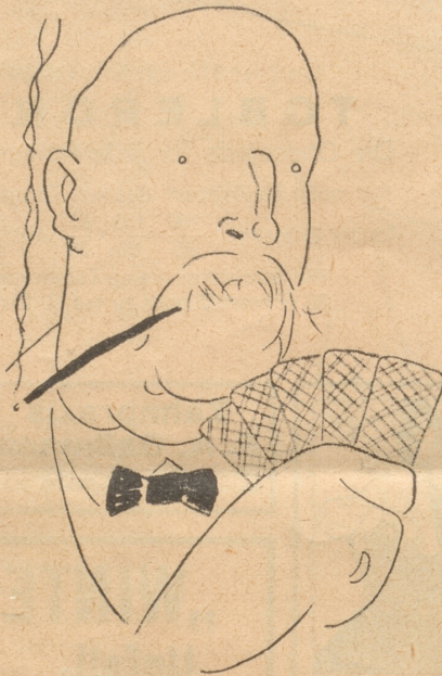
Der Weltmeister im Kreuzfuß.