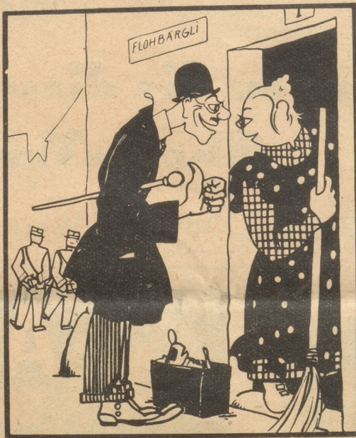
„Sit dann d'Polizei wieder e Hufe Uniformierte igstellt her, geht me viel weniger Lüt uf der Stroß!“

„Susanne“, rief ihre Herrin, „ich glaube, Sie sind eine schlechte, verräterische Person. Jetzt fällt mir ein, daß ich Sie mit jemand über die Gartenhecke sprechen sah.“