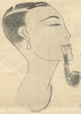
Der Filmstern Hia-Hu in der Titelrolle von „Weib oder Mann“.