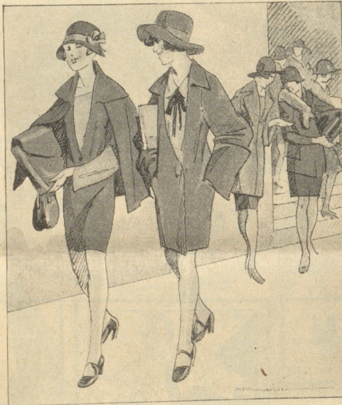
„Das Interessanteste an der Ehe ist doch die Scheidung.“ — „D, meine Liebe, die Witwenschaft hat auch ihre Reize.“ — e. Kire

statte ich Ihnen das nicht, Sie zwingen mich dazu. Ralph, sagen Sie Mr. Godfrey und Mr. Kent, daß wir in fünf Minuten bei ihnen sein werden.“