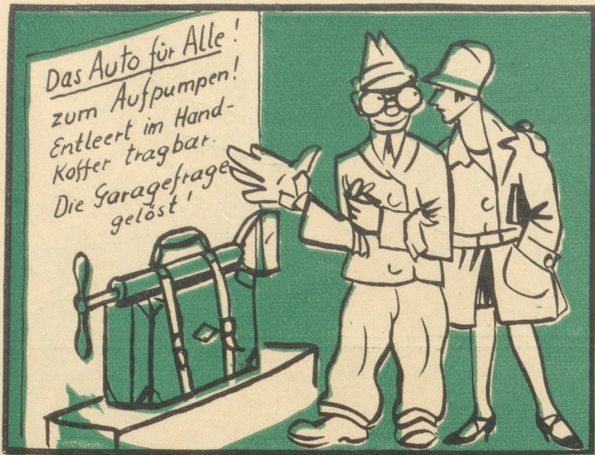
— Das imponiert mir, das hole mir!