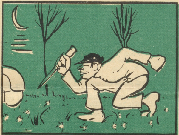
— Wartet ihr Chöge, ihr!