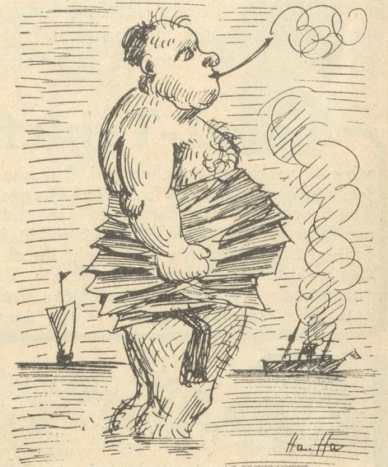
Warum denn nicht die Wadenbinden Sich um den Bauch beim Baden winden.