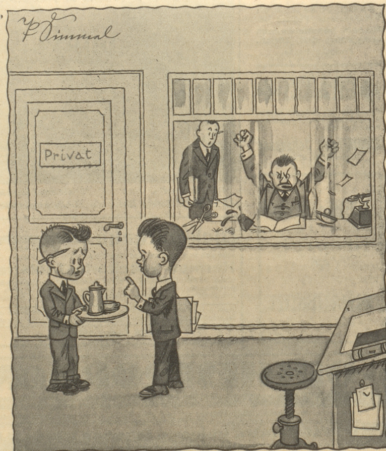
Stift: „Diese Loberei! Von morgen ab bringe ich dem Chef aber Kaffee Hag.“

Frau Stadtrichter: „Und Ihre Geufer ist dann au ytrochnet, Sie Feusi selig.“