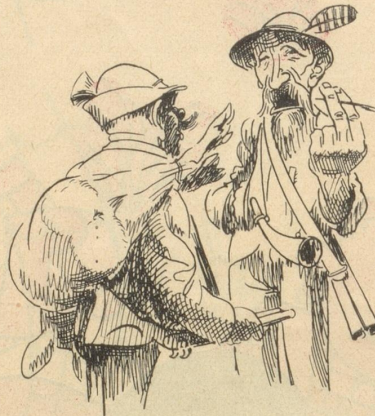
„Scheibe gschbässig, die Zohr was kan offizielle Saaketag ge hät, han i vill meh Gsell gha.“