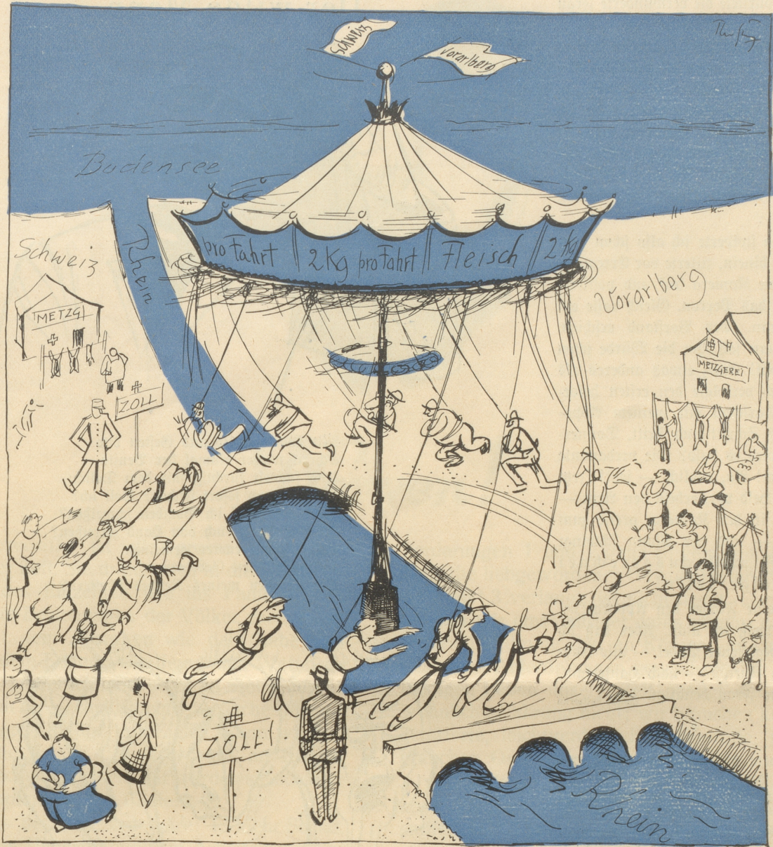
Um den Betrieb zu vereinfachen, hat man im Rhein einen Rundlauf errichtet.

Im St. Gallischen Rheintal wird von der Erlaubnis, pro Tag zwei Kilo Fleisch zollfrei einzuführen, außerordentlich stark Gebrauch gemacht.