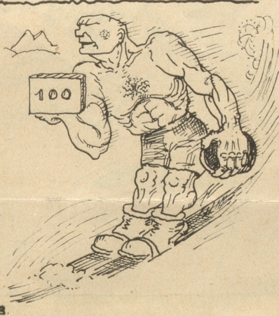
Der Sohn trainiert für sämtliche Olympiaden.