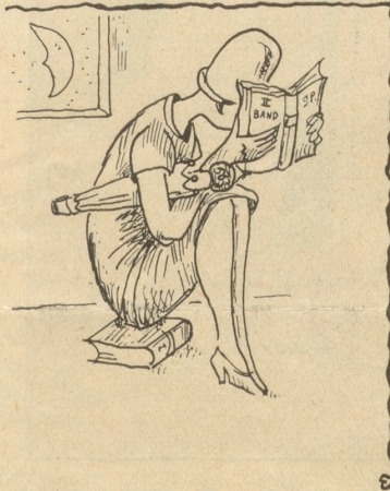
Die Tochter kommt nicht mehr von Spittelers Olympischem Frühling weg.