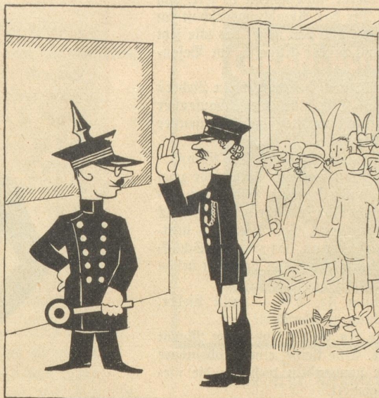
„De Zugführer hät gseit, er tüeg dänn en Pfiff, wänn's getti.“ „Guet, so göhnd äfängs gäg dr Maschine vüre ga d'Lüt ärbegsteufe, daß 's mi gsehnd.“