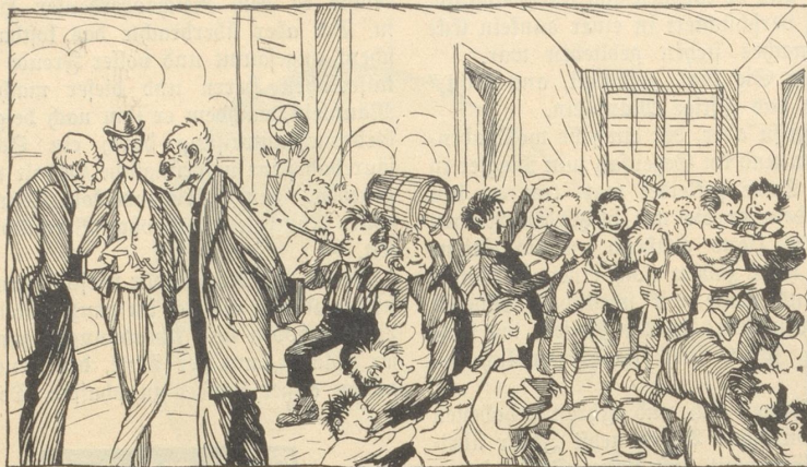
Der Unterricht ist im Gang.