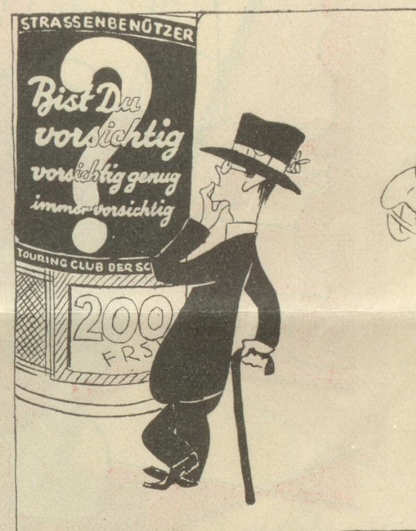
bist Du immer