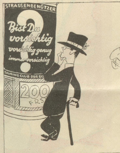
bist Du immer