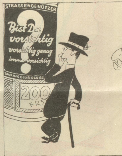
bist Du immer