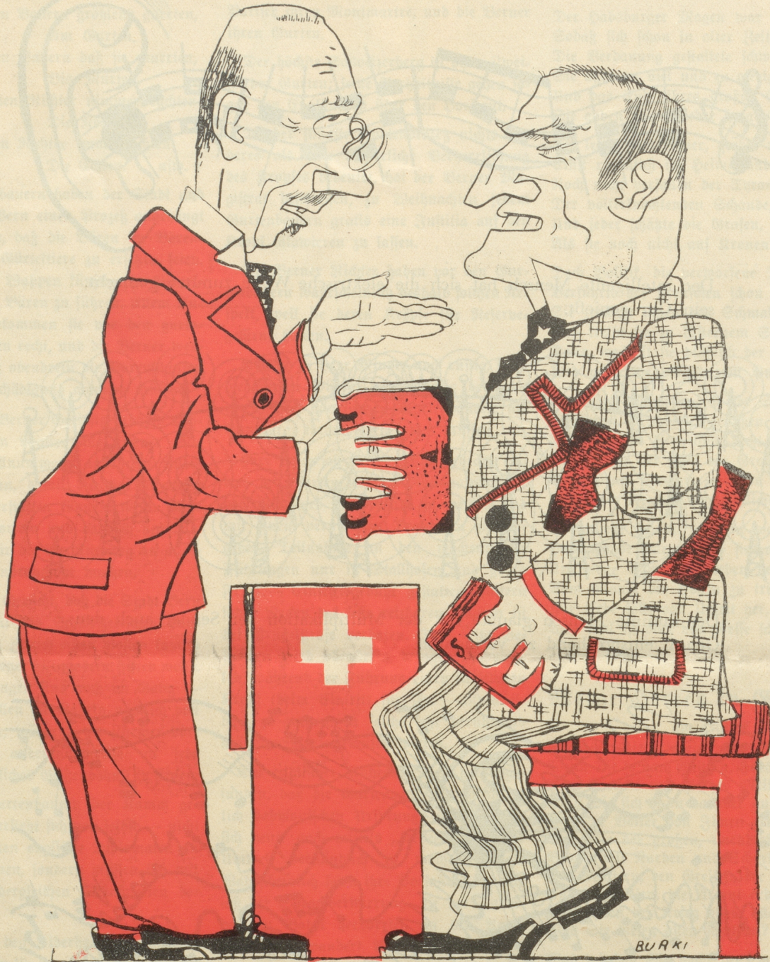
Mister McAllan: „O — im Lande Uilhelm Tell man machen zu grosse Propaganda für eine kleine Ausverkauf. Uo sein da Uahreit in der Reklame?“

Mein Aeltester buchstabiert in der Zeitung herum.