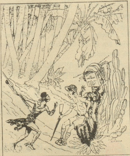
„Maffa, wir haben Löwenspuren in nördlicher Richtung gefunden.“ „Unverzüglich nach Süden aufbrechen!“