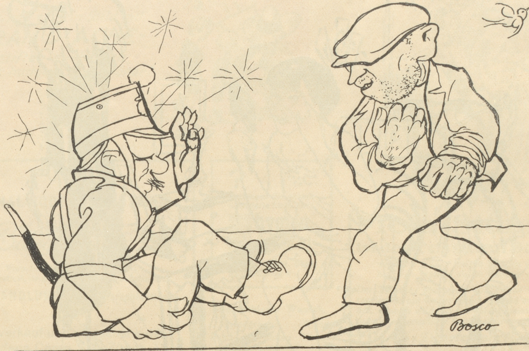
Polizist: „Stell ab, ich weiß es jetzt scho!“