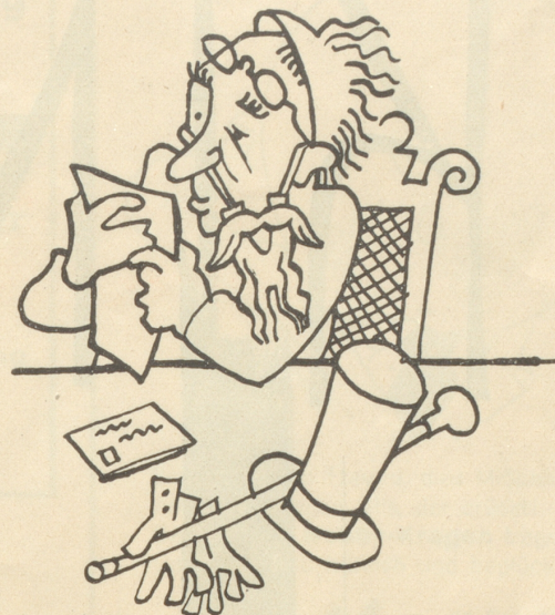
Kannst denken! Ein Blindgänger wirst. Das Theater reagiert glänzend ab, indem es sagt: Was verstehst Du überhaupt von unserem Theater? Wo Du nicht einmal weißt, wo der Schlüssel zur Garderobe hängt! Hi-hi!