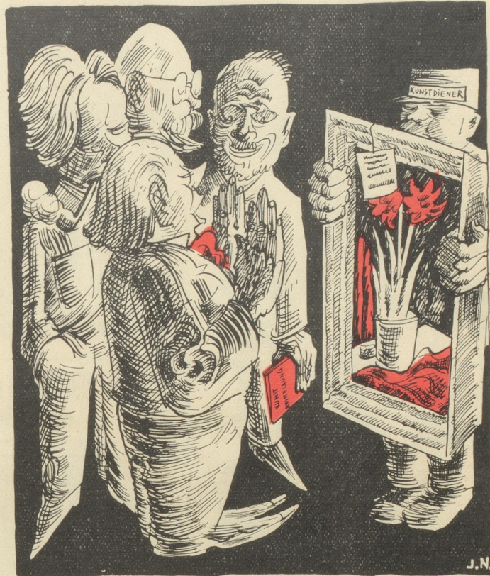
„'s Bild wär recht, aber de jung Maler soll warte mit usstelle, bis er en Name hät.“

BURGERS MILDE STUMPEN Nikotinschwach und doch aromatisch Gelbe Packung 80 Cts. — Weiße Packung Fr. 1.— Feine Derby Burger . . . . 10 Stück Fr. 2.—