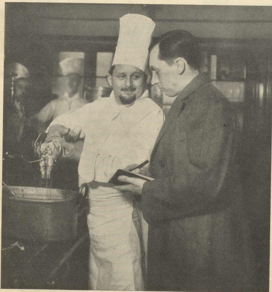
Einer unserer Reporter interviewt einen Restaurateur

Der Schweizer-Spiegel wäre nicht die Zeitschrift, die er ist, wenn sich seine Redaktoren und Mitarbeiter begnügen würden, unfer den einlaufenden Manuskripten eine Auswahl zu treffen. Die Initiative für \frac{3}{4} aller Beiträge geht von der Redaktion aus.