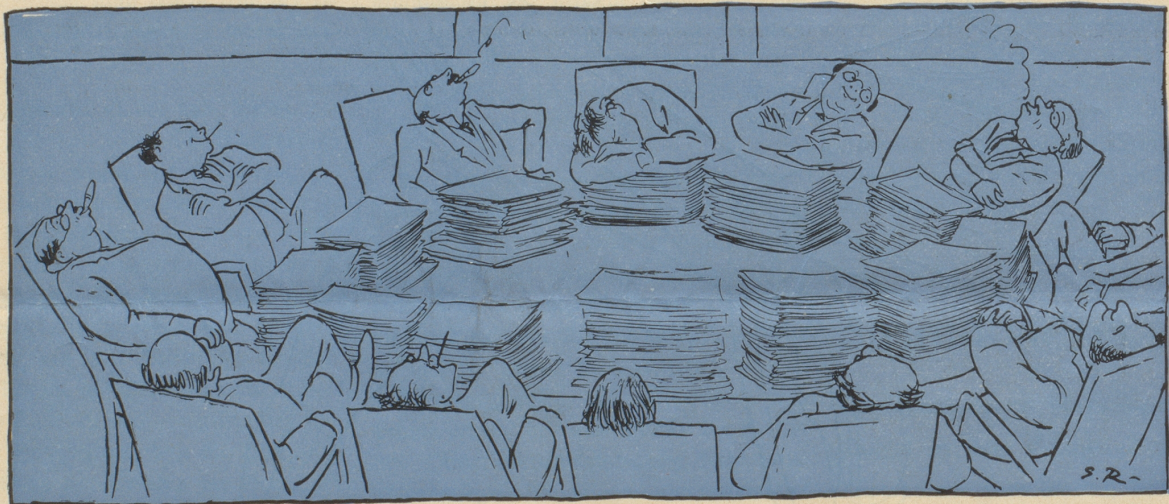
Im Jahre 1931 gab es eine grosse Wirtschaftskrise in der Welt. Die Minister aller Länder versammelten sich in Genf. Sie konferierten, konferierten und dann ruhten sie sich aus. Die Wirtschaftskrise dauerte trotzdem weiter.

Im Jahre 1935 gab es eine grosse Wirtschaftskrise in der Welt . . . usw. usw.