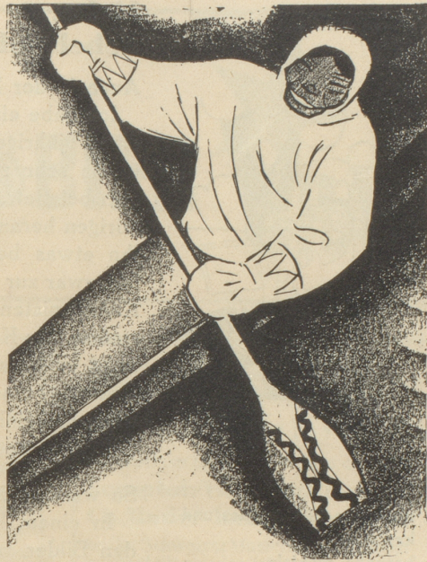
2. Der Eskimo trägt keine SUN , weil er sie nicht kennt.