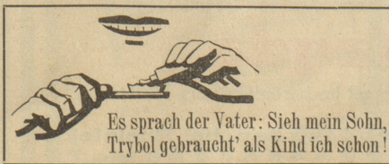
Es sprach der Vater: Sieh mein Sohn, Trybol gebraucht' als Kind ich schon!