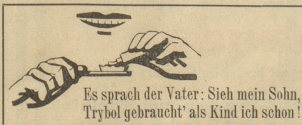
Es sprach der Vater: Sieh mein Sohn, Trybol gebraucht' als Kind ich schon!