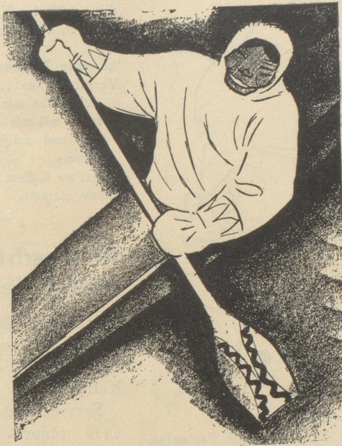
2. Der Eskimo trägt keine SUN , weil er sie nicht kennt.