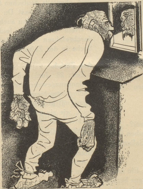
3. Der Hintermoser trägt keine SUN , weil ihm seine baumwollene Unterhose besser gefällt.