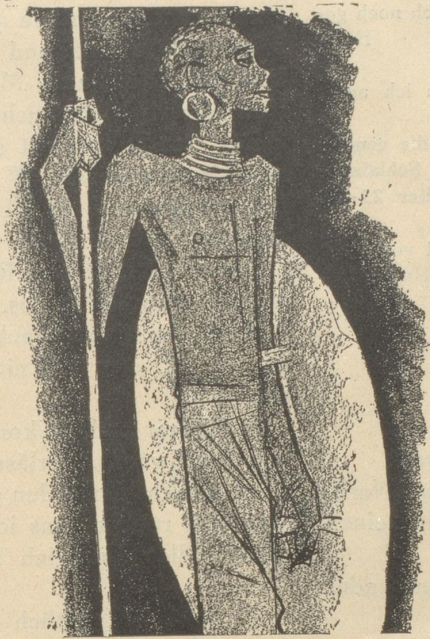
1. Der Zulu trägt keine SUN , weil er sie nicht braucht.