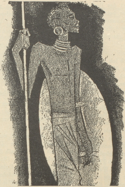
1. Der Zulu trägt keine SUN , weil er sie nicht braucht.