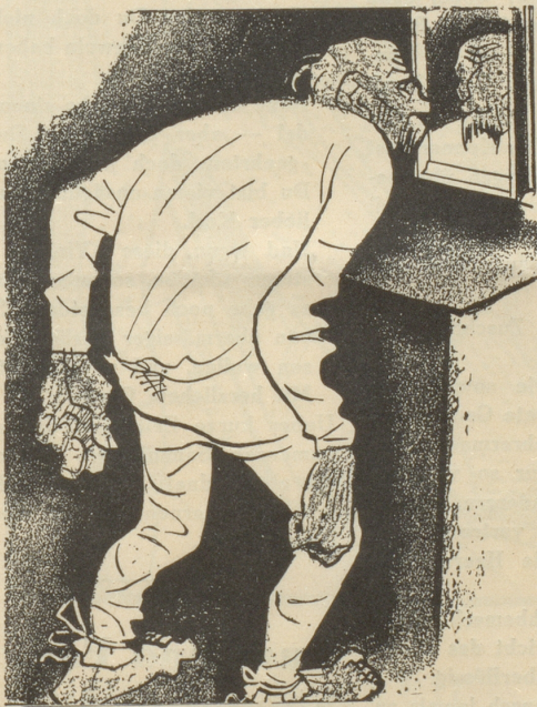
3. Der Hintermoser trägt keine SUN , weil ihm seine baumwollene Unterhose besser gefällt.