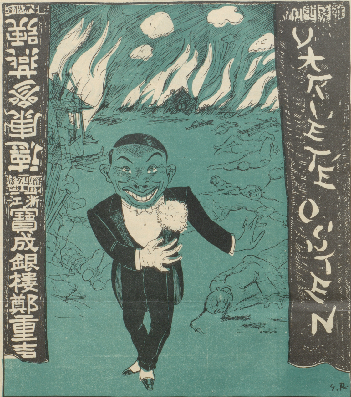
„Meine Damen und Herren! Es ist eine kleine friedliche Aktion eines friedliebenden Volkes!“