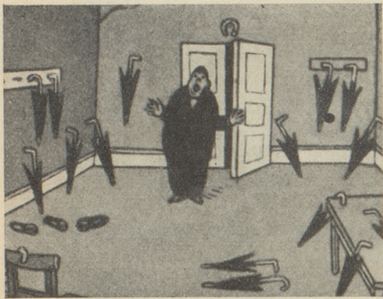
Nach der großen „Kaspar“ Professoren-Konferenz