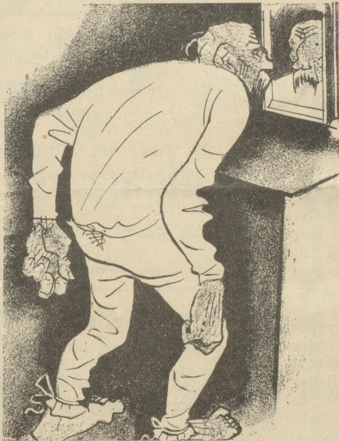
3. Der Hintermoser trägt keine SUN , weil ihm seine baumwollene Unterhose besser gefällt.