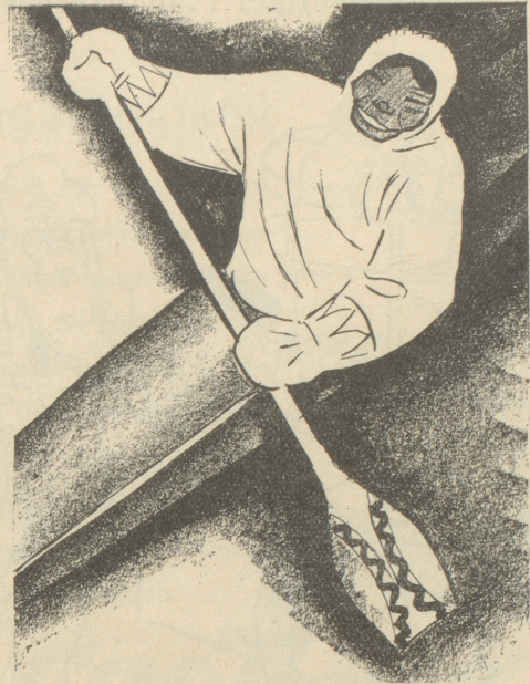
2. Der Eskimo trägt keine SUN , weil er sie nicht kennt.